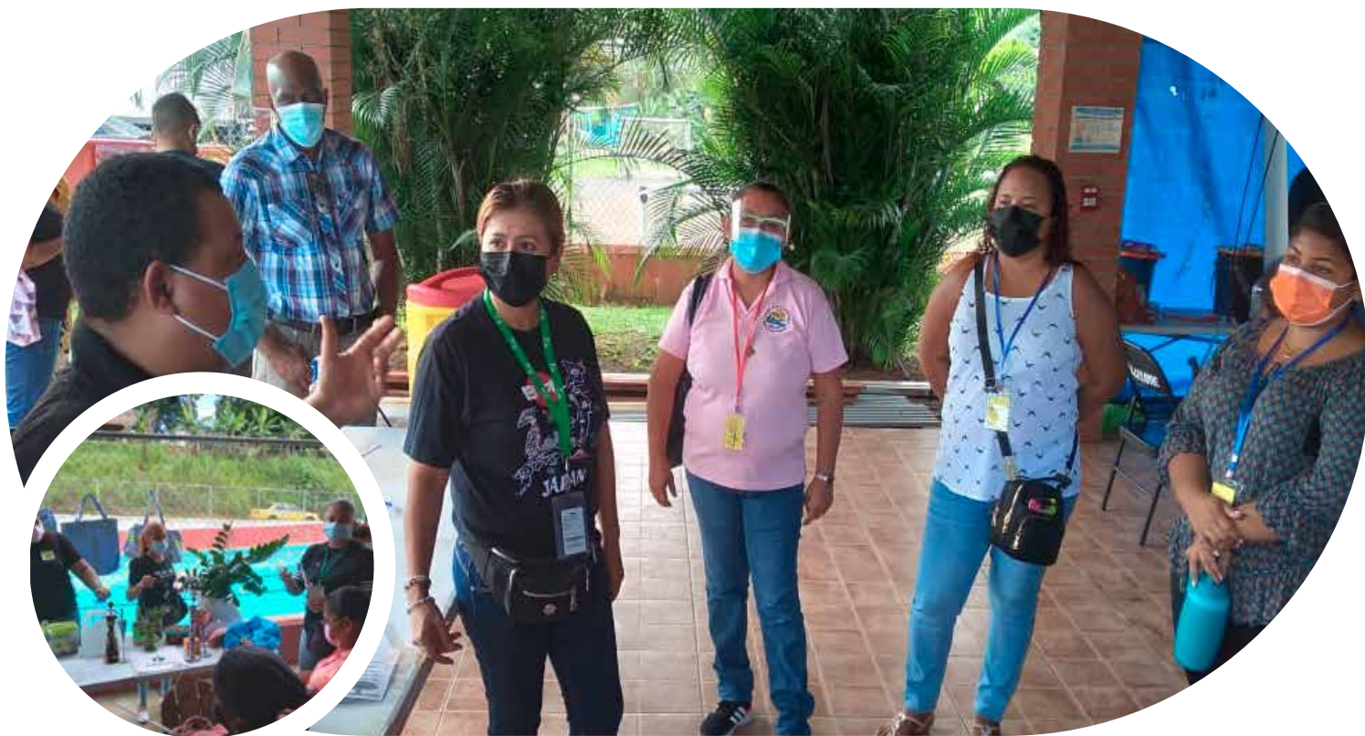
Taller "Convirtiendo los Residuos en las 5 Rs"