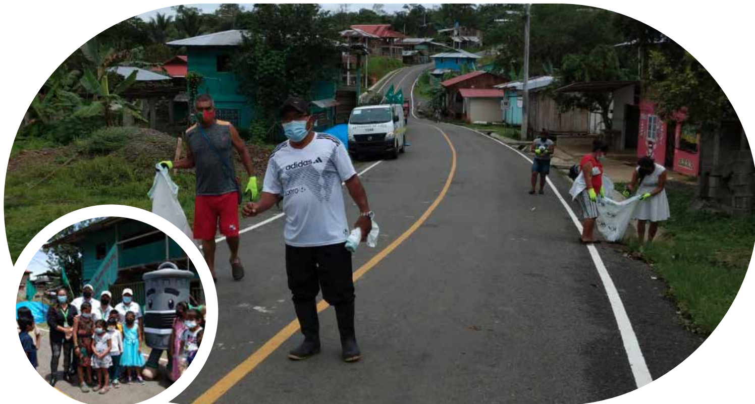
Jornada de limpieza en la comunidades del Valle del Riscó, Bocas del Toro