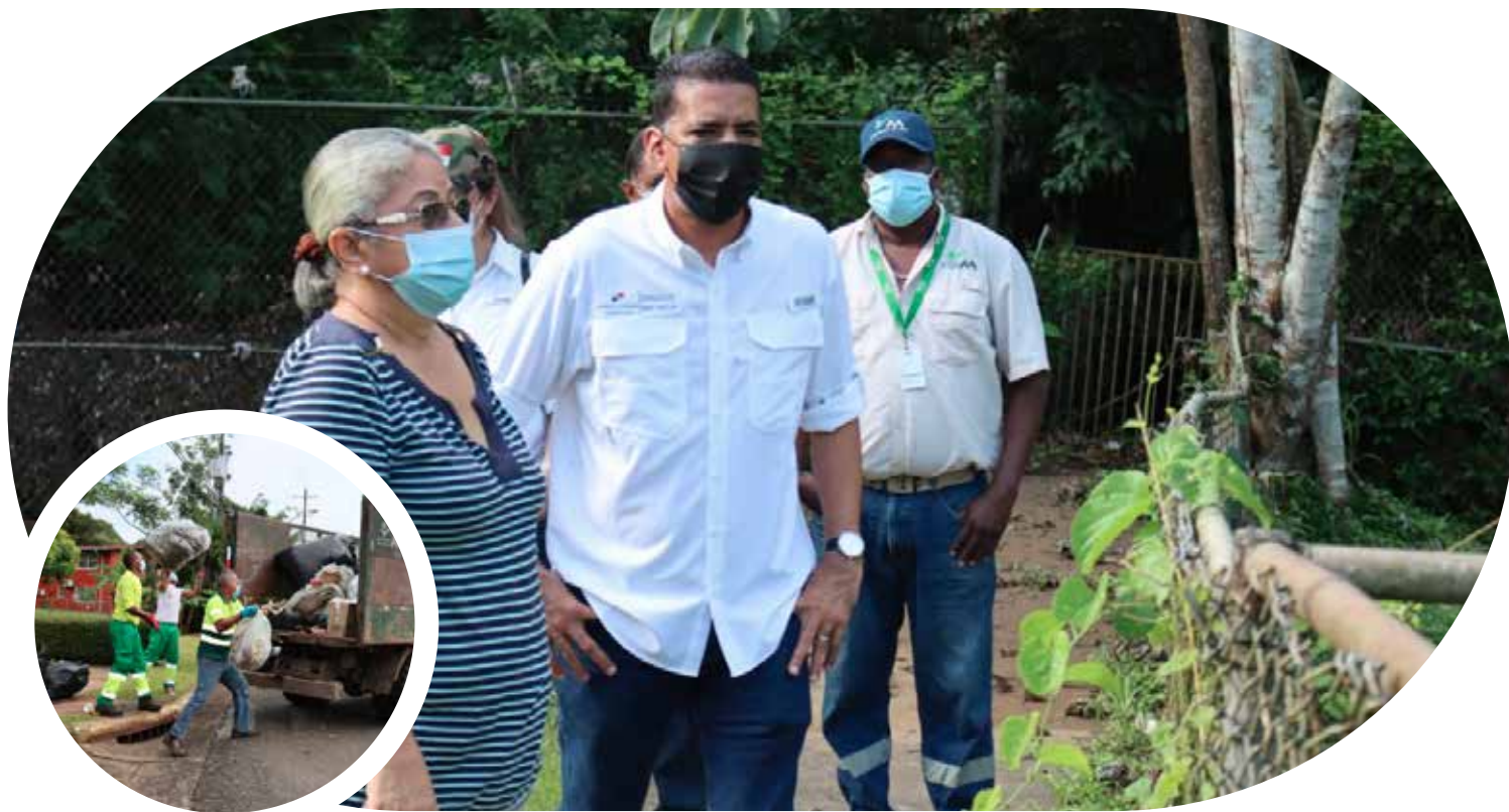
Administrador General, Pedro Castillo, escucha a los residentes del sector de Clayton, durante la jornada de limpieza