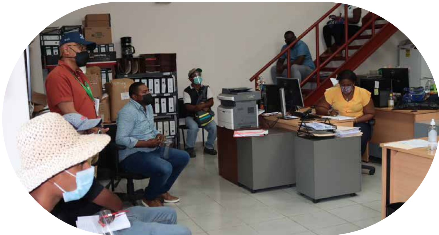
Reunión con los segregadores entre administrativos de la AAUD y representantes de la empresa Urbalia Panamá, S.A.