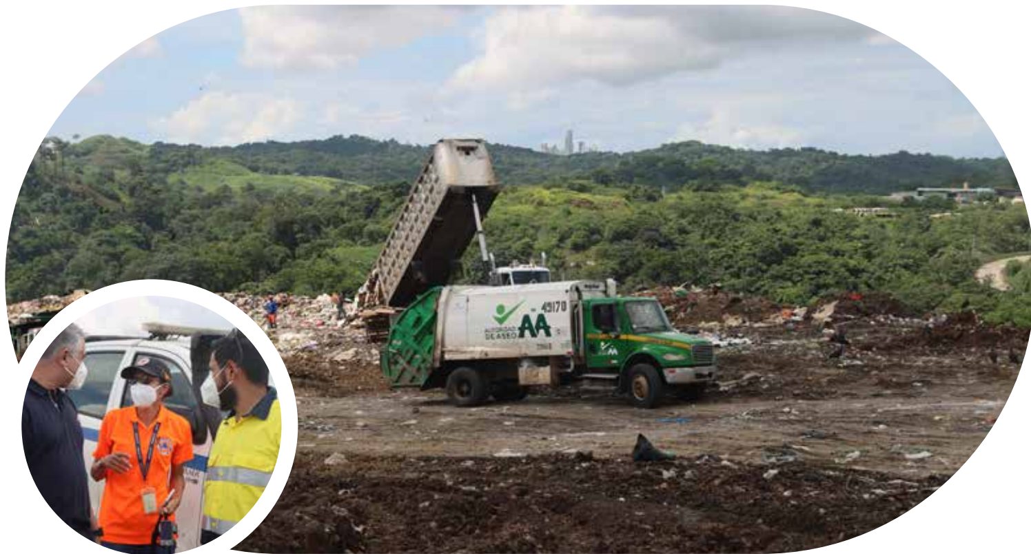
Relleno sanitario de Cerro Patacón